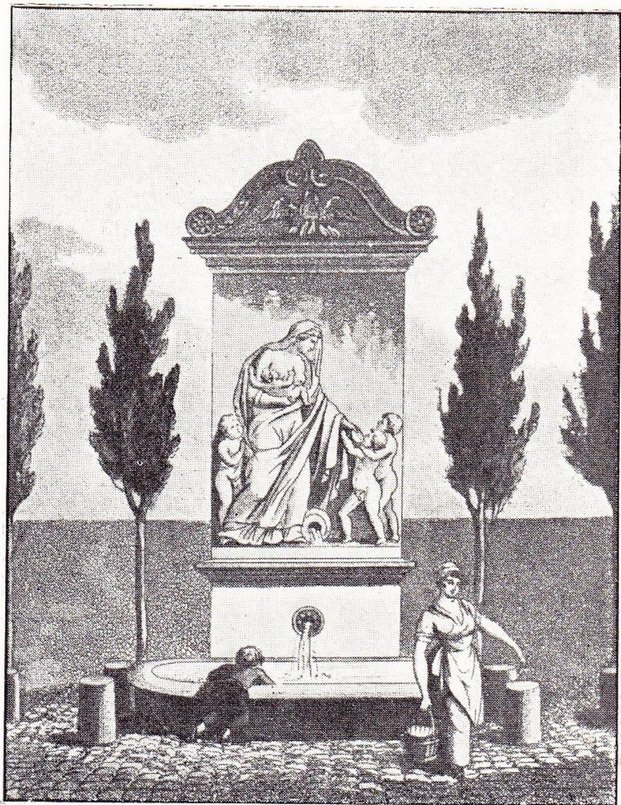
LES FONTAINES DE PARIS. Fontaine de Popincourt.